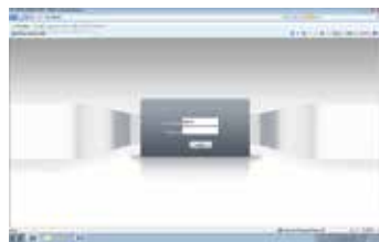
Prikaz pre prijave (gore) i posle (dole) prijave.

Otvorite Internet Explorer, zatim ukucajte IP adresu i pritisnite enter, ukucajte korisničko ime i lozinku. Sada možete da pristupite vašoj IP kameri.