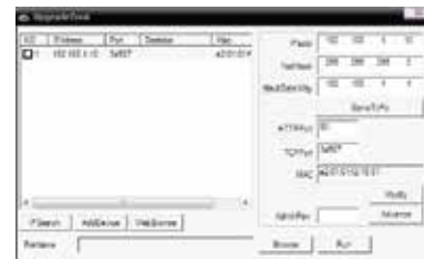
Upgrade Tool prozor

Za konfigurisanje kamere potrebno je instalirati softver koji možete preuzeti sa interneta ili ga možete naći na CD disku koji ste dobili uz kameru. Softver na CD disku se nalazi na sledećoj putanji: CD->English->Software. Tu odaberite i pokrenite Upgrade Tool da biste instalirali program na Vaš računar. Kada se instalacija završi, pokrenite program Upgrade Tool, pritisnite "IP Search" i biće Vam prikazana IP adresa vaše kamere.