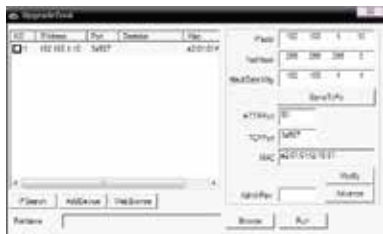
Upgrade Tool prozor

Za konfigurisanje kamere potrebno je instalirati softver koji možete preuzeti sa interneta ili ga možete naći na CD disku koji ste dobili uz kameru. Softver na CD disku se nalazi na sledećoj putanji: CD->English->Software. Tu odaberite i pokrenite Upgrade Tool da biste instalirali program na Vaš računar. Kada se instalacija završi, pokrenite program Upgrade Tool, pritisnite "IP Search" i biće Vam prikazana IP adresa vaše kamere.