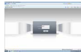
Prikaz pre prijave (gore) i posle (dole) prijave.

Otvorite Internet Explorer, zatim ukucajte IP adresu i pritisnite enter, ukucajte korisničko ime i lozinku. Sada možete da pristupite vašoj IP kameri.